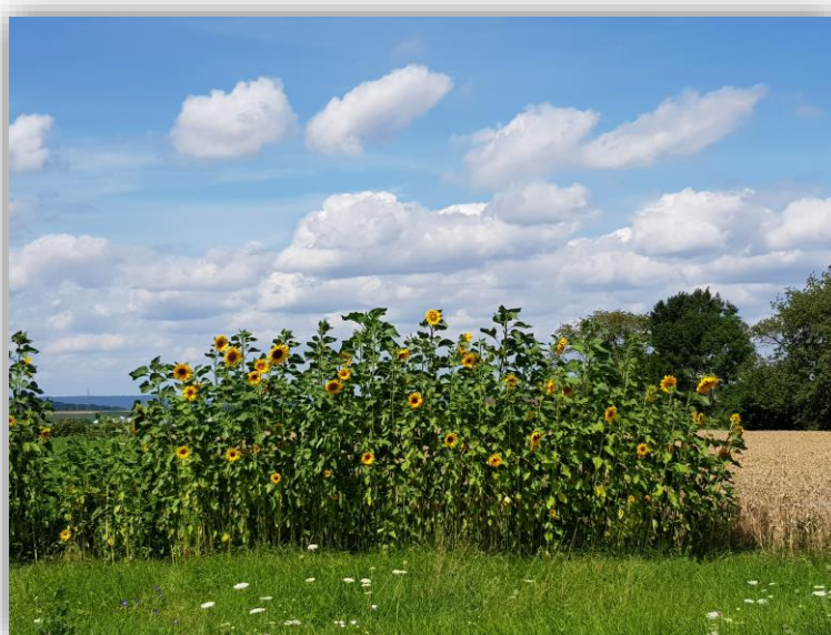
Sonnenblume trifft Herbstwind - Sommer 2021 (MW)